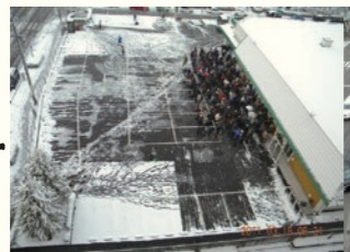
2011年3月18日 8時31分 / March 18, 2011 at 8:31