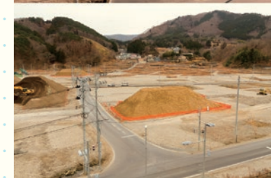
(上) 2011年4月6日 / (Top) April 6, 2011 (中) 2012年1月15日 / (Center) January 15, 2012 (下) 2013年3月25日 / (Bottom) March 25, 2013

女川町黄金町方面を望む / View of Koganecho, Onagawa 宮城県女川町 / Onagawa Town, Miyagi 越後谷 出 / Izuru Echigoya