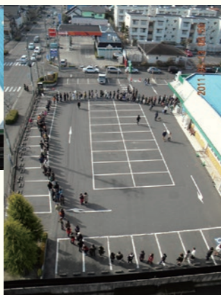
2011年3月13日 8時50分 / March 13, 2011 at 8:50