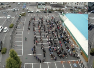
2011年3月15日 9時11分 / March 15, 2011 at 9:11