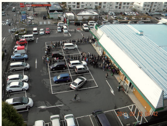
2011年3月12日 8時42分 / March 12, 2011 at 8:42