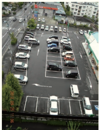
2012年9月25日 11時6分 / September 25, 2012 at 11:06