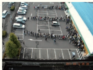
2011年3月12日 9時39分 / March 12, 2011 at 9:39