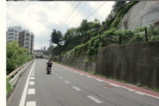
(上) 2011年3月13日 7時34分 / (Top) March 13, 2011 at 7:34 (下) 2012年8月25日 / (Bottom) August 25, 2012

鹿落坂 / Shishiochizaka 宮城県仙台市太白区 / Taihaku-ku, Sendai, Miyagi