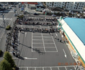
2011年3月14日 8時57分 / March 14, 2011 at 8:57

みやぎ生協虹の丘店の行列の変化 / Changes in the Line at Miyagi Seikyo Nijino-oka Store 宮城県仙台市泉区 / Izumi-ku, Sendai, Miyagi 高橋良造 / Ryozo Takahashi