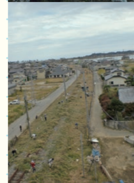
(上) 2011年3月12日 / (Top) March 12, 2011 (下) 2011年10月2日 / (Bottom) October 2, 2011

JR 仙石線 (新東名) / JR Senseki Line (Shintona) 宮城県東松島市 / Higashimatsushima, Miyagi NPO 法人 創る村 / Tsukurumura, N.P.O.