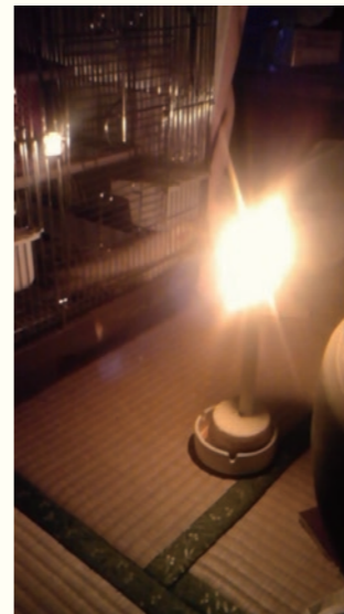
手作りの燭台でろうそくを灯した / I lit a candle on a handmade candleholder. 2011年3月11日 17時56分 / March 11, 2011 at 17:56 宮城県仙台市 / Sendai, Miyagi イル / il

Also, a common topic across those notes is the feeling of uneasiness, to be seen as "affected people" from outside of the affected areas, while they feel "I'm not an affected person, having suffered no major loss — only some inconvenient life."