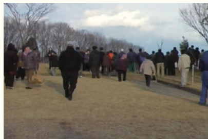
高台から海と町の様子を見る人びと／ People watching the ocean and town from a high ground 2011年3月11日 16時11分／March 11, 2011 at 16:11