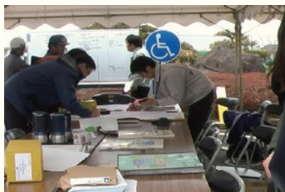
役場の外に設置された防災対策本部／ The Headquarter of the Disaster Countermeasure Office set outside of Town Hall 2011年3月11日 15時56分／March 11, 2011 at 15:56