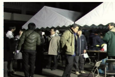
日が暮れて本部周りだけライトが灯る／ The sun sets and lights are seen only around HQ 2011年3月11日 19時13分／March 11, 2011 at 19:13