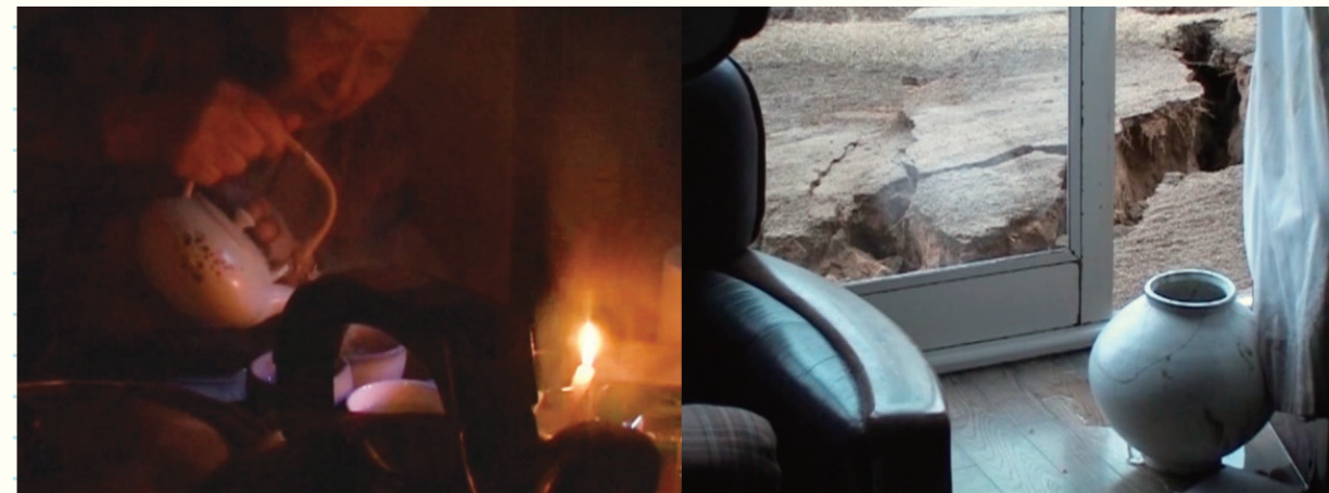
2011 東日本大震災 仙台一市民の記録 / A Sendai Citizen's Record of the Great East Japan Earthquake in 2011

On the night of March 11th, one person recorded his wife cooking dinner in the midst of a blackout as well as the process of reconstruction from a landslide a year ago. Also, there are recordings by another person who got the tsunami warning and evacuated to the town hall, recording the subsequent inauguration of the headquarter and the evacuation center. Among those moving images are of people who, from high ground noticed the tsunami coming, as well as videos of his family cleaning up after the damage from the tsunami.