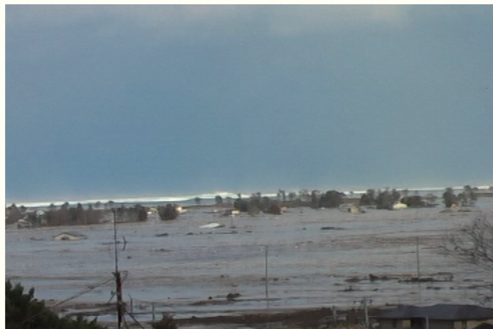
津波の様子／The tsunami 2011年3月11日 16時12分／March 11, 2011 at 16:12