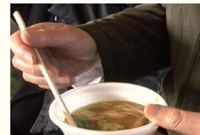
数が足りず1人1本の箸で食べる／ Not enough - only one chopstick per person to eat 2011年3月12日 8時28分／March 12, 2011 at 8:28