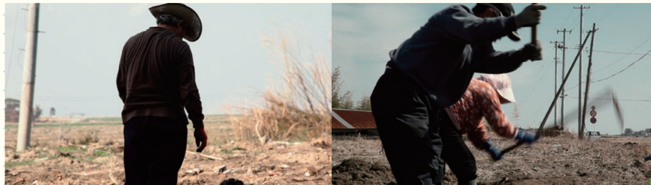
沿岸部の風景／A View of the Coast 2011年—2013年／2011 to 2013 岩手県、宮城県、福島県／Iwate, Miyagi, Fukushima 鈴木啓太／Keita Suzuo

"Record of Coastal Landscape" is a piece for exhibition, in which the landscape filmed in panoramic format is screened onto the large screen of 2.4m in height and 12m in width. Viewers who stand in front of the work experience the landscape that is way larger than their eyesight. Although it may seem like a freeze-frame at the first glance, if one keeps looking, the cloud is slightly moving at the background.